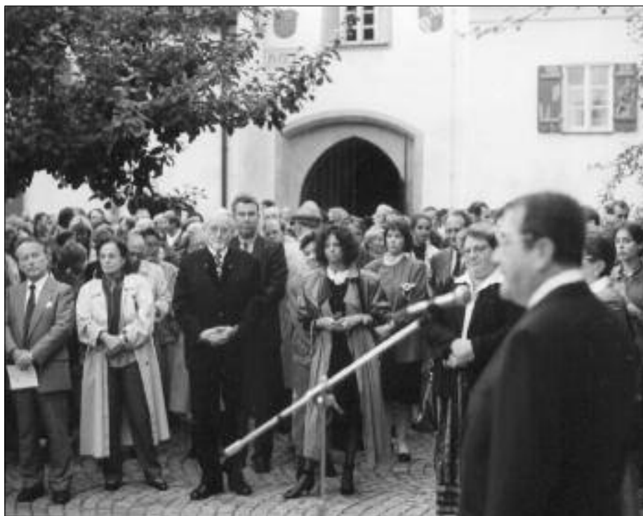
Eröffnung der „Kunstlandschaft Würm II“ im September 1988.