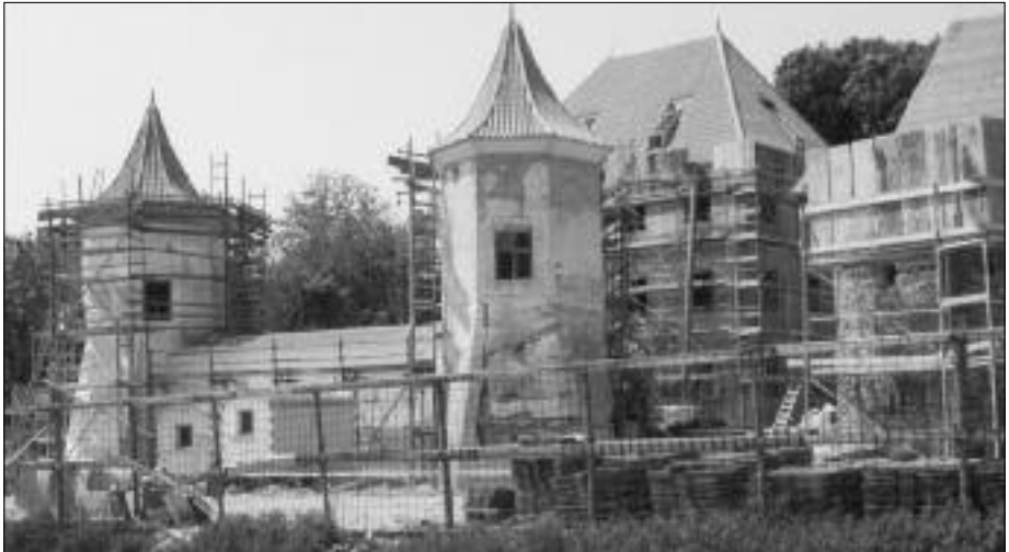
Das erste Ziel: Erhalt von Schloss Blumenburg (Aufnahme vom 31. Mai 1982)

Alle Veranstaltungen und Aktionen des Vereins aufzulisten, ist natürlich hier nicht möglich. Es wurden deshalb nur immer die wichtigsten und nur jeweils die Veranstaltungen aufgeführt, die erstmalig vom BBV initiiert wurden.