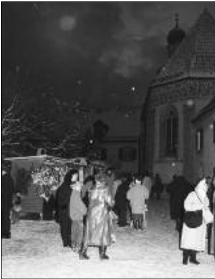
Ein Bild aus den ersten Jahren der heute weit über München hinaus bekannten „Blutenburger Weihnacht“.