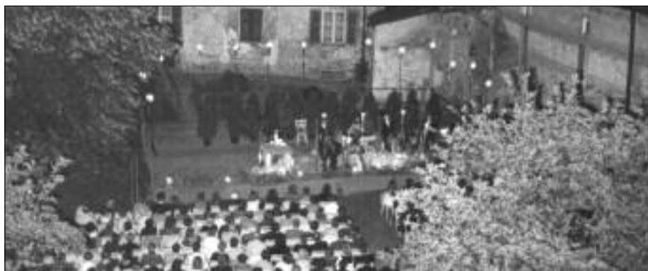
Die kulturelle Belegung des Schlosshofes begann bereits 1968 mit den Blütenburger Konzerten von Willi Fries. Der BBV und die Konzertreihe pflegen bis heute eine enge Verbindung und Zusammenarbeit.