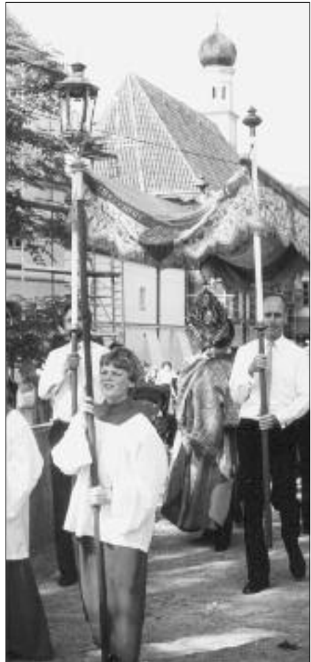
Die Fronleichnamsprozession der Pfarrei Leiden Christi findet traditionell in Verbindung mit dem Obermenzinger Dorffest in Schloss Blütenburg statt.