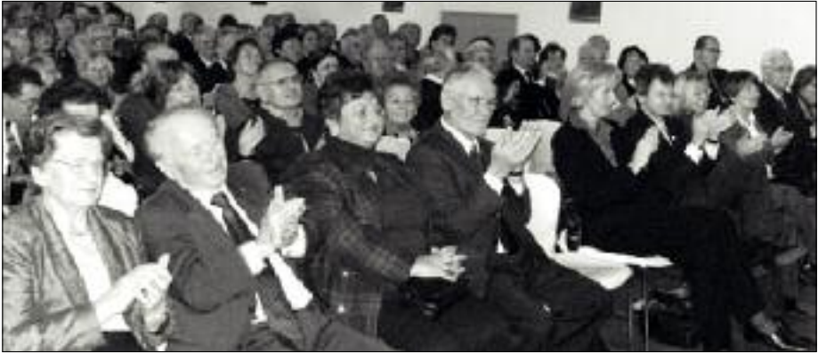
Über 400 Gäste freuen sich alljährlich bei der Festlichen Matinée über die von Willi Fries liebevoll arrangierten musikalischen Höhepunkte.