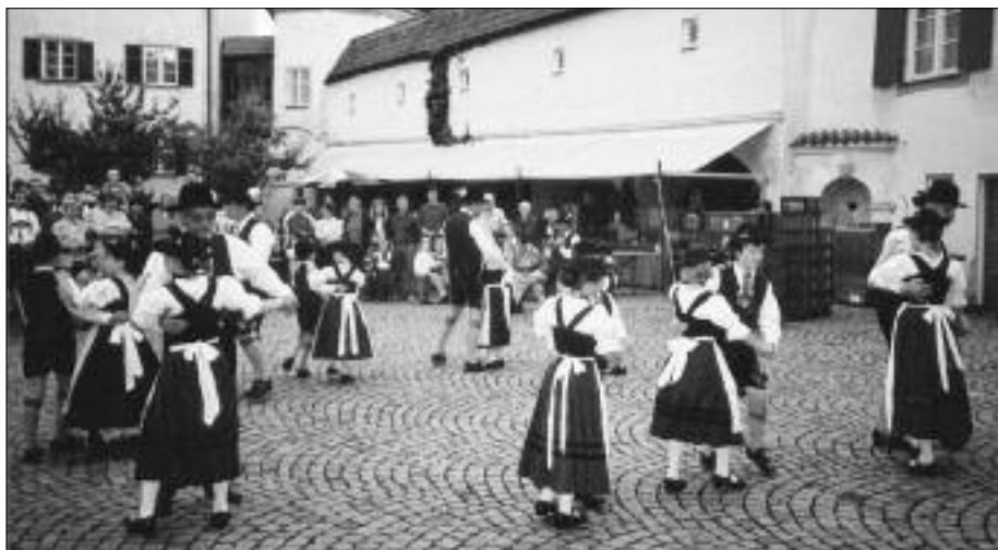
Das Obermenzinger Dorffest in Schloss Blutenburg hat sich auf Betreiben des BBV in den letzten Jahren mehr und mehr zum Fest der Vereine aus dem Stadtteil entwickelt.

24. Mai: Mitgliederversammlung des Vereins Internationale Jugendbibliothek (IJB) bestätigt Schloss Blutenburg als künftigen Sitz der IJB