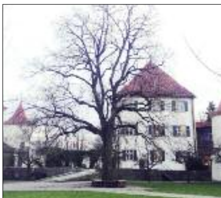
Die Blütenburger „Friedens“-Linde mit neuer Holzbank.

20./21. September: BBV-Fahrt zur Bayerischen Landesausstellung „Main und Meer“ nach Bamberg und Schweinfurt