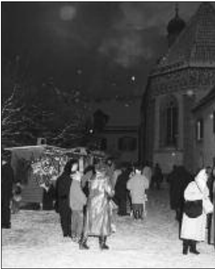
Ein Bild aus den ersten Jahren der heute weit über München hinaus bekannten „Blutenburger Weihnacht“.