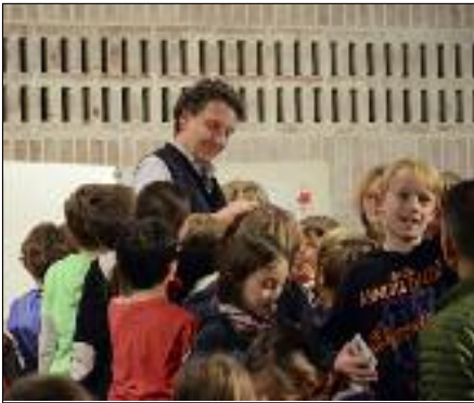
Kinderbuchautor Erhard Dietl mit seinen Fans beim Projekttag.

7. November: Abschlussveranstaltung und Empfang zum 40 Jahre BBV-Wettbewerb mit der GS an der Grandlstraße 5