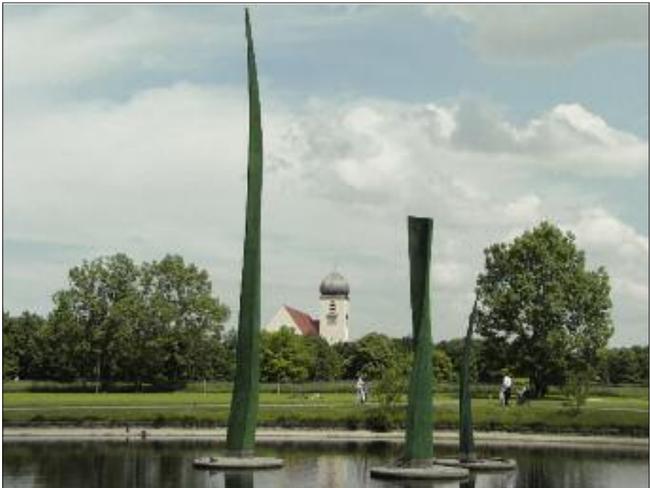
“Sich aufrichtende Halme” von Hermann Bigelmayer - ein Beitrag der Initiative “Kunst an der Würm” zur Bundesgartenschau 2005.

Oktober: 1. BBV-Fahrt zur Ausstellung „König Ludwig I. von Bayern und sein Schloss in der Pfalz“