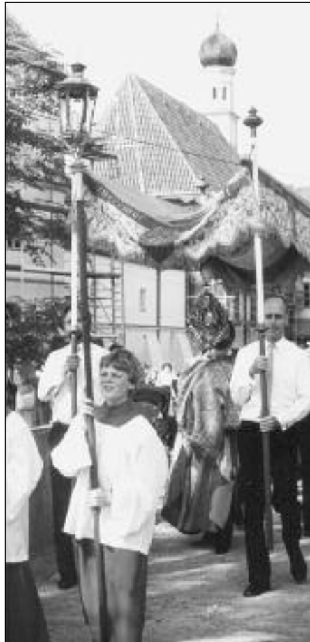
Die Fronleichnamsprozession des Pfarrverbandes Leiden Christi und St. Leonhard findet traditionell in Verbindung mit dem Obermenzinger Dorffest in Schloss Blütenburg statt.

10. Februar: 1. Orchideenball zugunsten von Schloss Blütenburg im Hotel Bayerischer Hof