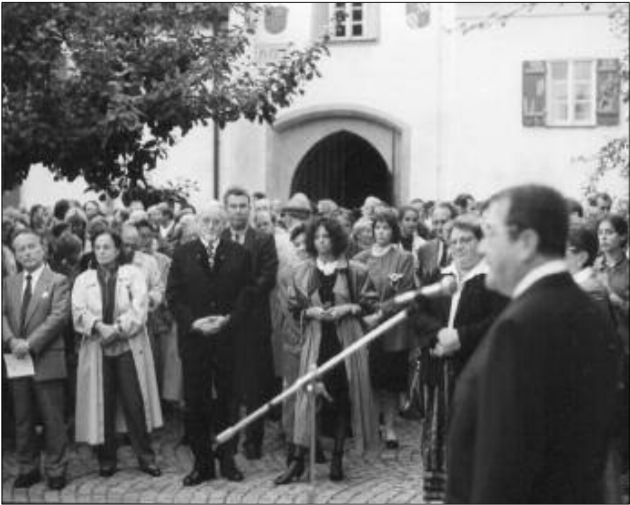
Eröffnung der „Kunstlandschaft Würm II“ im September 1988.