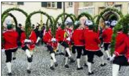
Anlässlich 45 Jahre BBV tanzten erstmals die Schäffler im Schlosshof, was sich über 1000 Besucher und Freunde des BBV nicht entgehen ließen.